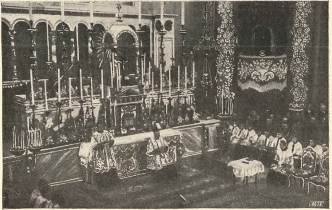
Torino. - Il Rettor Maggiore compie la funzione nella basilica di Maria Ausiliatrice

della Chiesa, non può disinteressarsi di questo vitale problema delle vocazioni sacerdotali. E difatti, con Nostra intima consolazione, la vediamo in ogni luogo distinguersi, come in ogni altro campo di cristiana attività, così in modo speciale in questo; e certamente il più ricco premio di tale sua operosità è appunto la copia veramente mirabile di vocazioni sacerdotali e religiose che vanno fiorendo in seno alle sue organizzazioni giovanili, mostrando con ciò di essere non solo un terreno fecondo di bene, ma anche una ben custodita e ben coltivata aiuola, dove i fiori più belli e più delicati possono svilupparsi senza pericolo. Sentano tutti gli ascritti all'Azione Cattolica l'onore che con ciò ricade sulla loro associazione e si persuadano che il laicato cattolico in nessun'altra maniera meglio che col collaborare a questo accrescimento delle file del clero secolare e regolare parteciperà davvero all'alta dignità di « regale sacerdozio » che il Principe degli Apostoli attribuisce a tutto il popolo dei redenti.