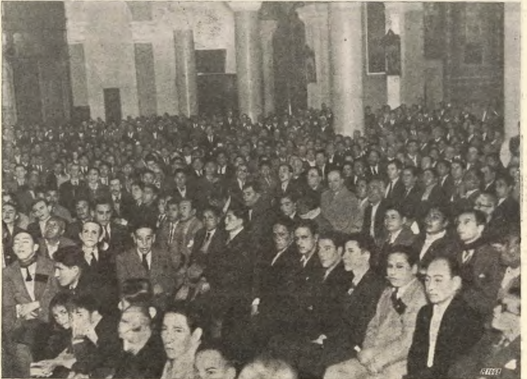
Lima (Perù). - In occasione del Congresso Eucaristico Nazionale, i Salesiani hanno promosso la "Settimana dell'operaio", e la Chiesa di Maria Ausiliatrice si è gremita di operai. Un angolo della Chiesa durante una predica.