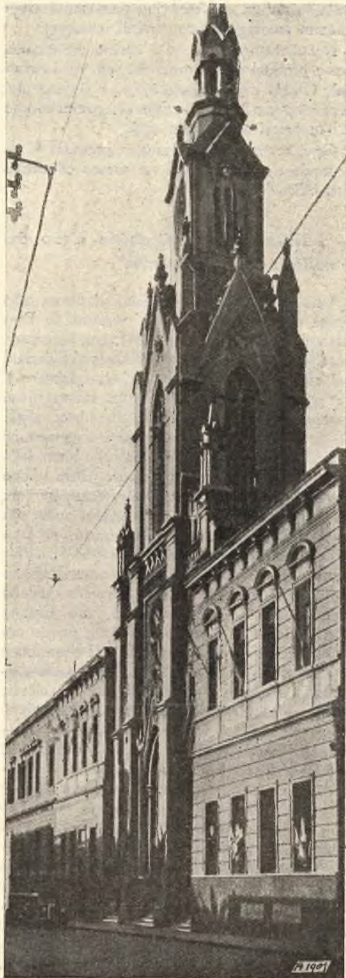
Buenos Aires. - Collegio e chiesa di Santa Caterina.

La capitale del Chubut ha accolto con immenso entusiasmo il suo Pastore confortando