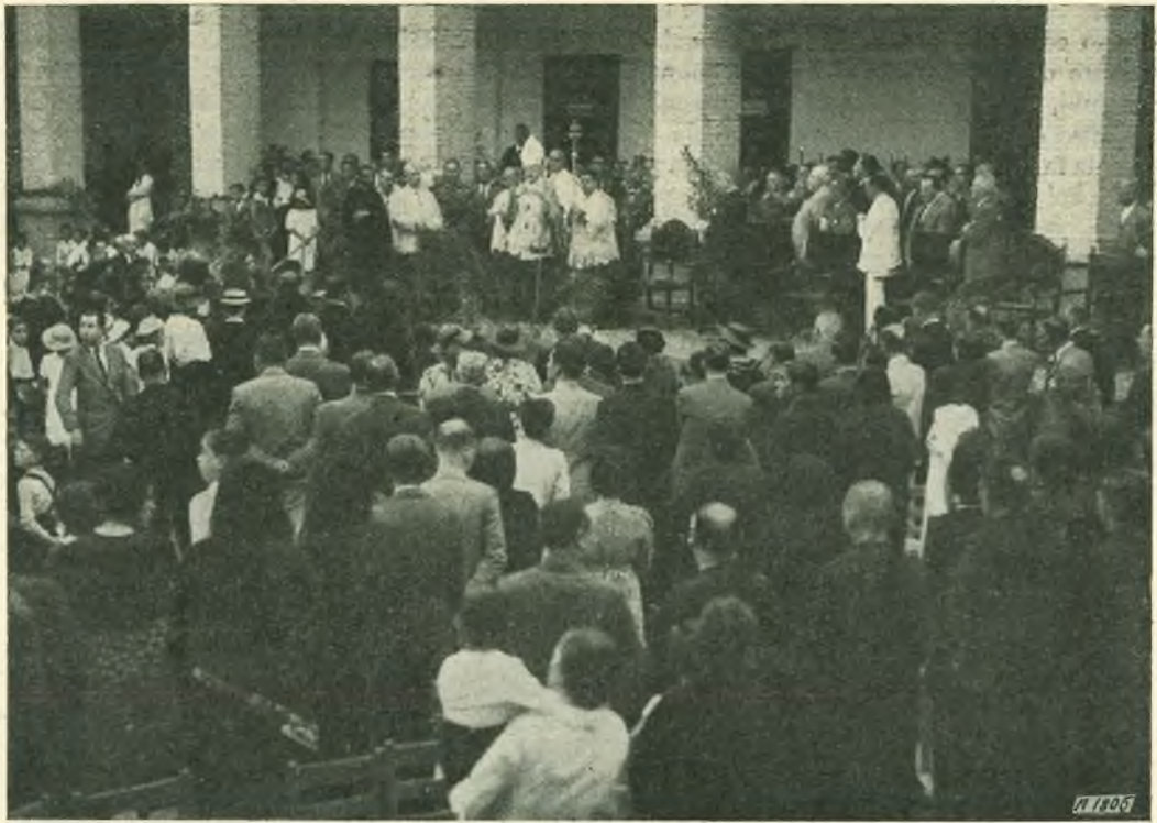
Siviglia. - S. Em. il Cardinale rivolge la parola al numeroso uditorio dopo la benedizione delle Scuole.

l'aiuto dello stesso Governatore, da lui collocata nel luogo preparato, al suono della banda, fra gli applausi e l'entusiasmo di tutti gli intervenuti. Poi, al canto dell'inno nazionale, sfilarono le trecento alunne della nostra scuola, chiudendo la festa, con un riuscito saggio ginnastico.