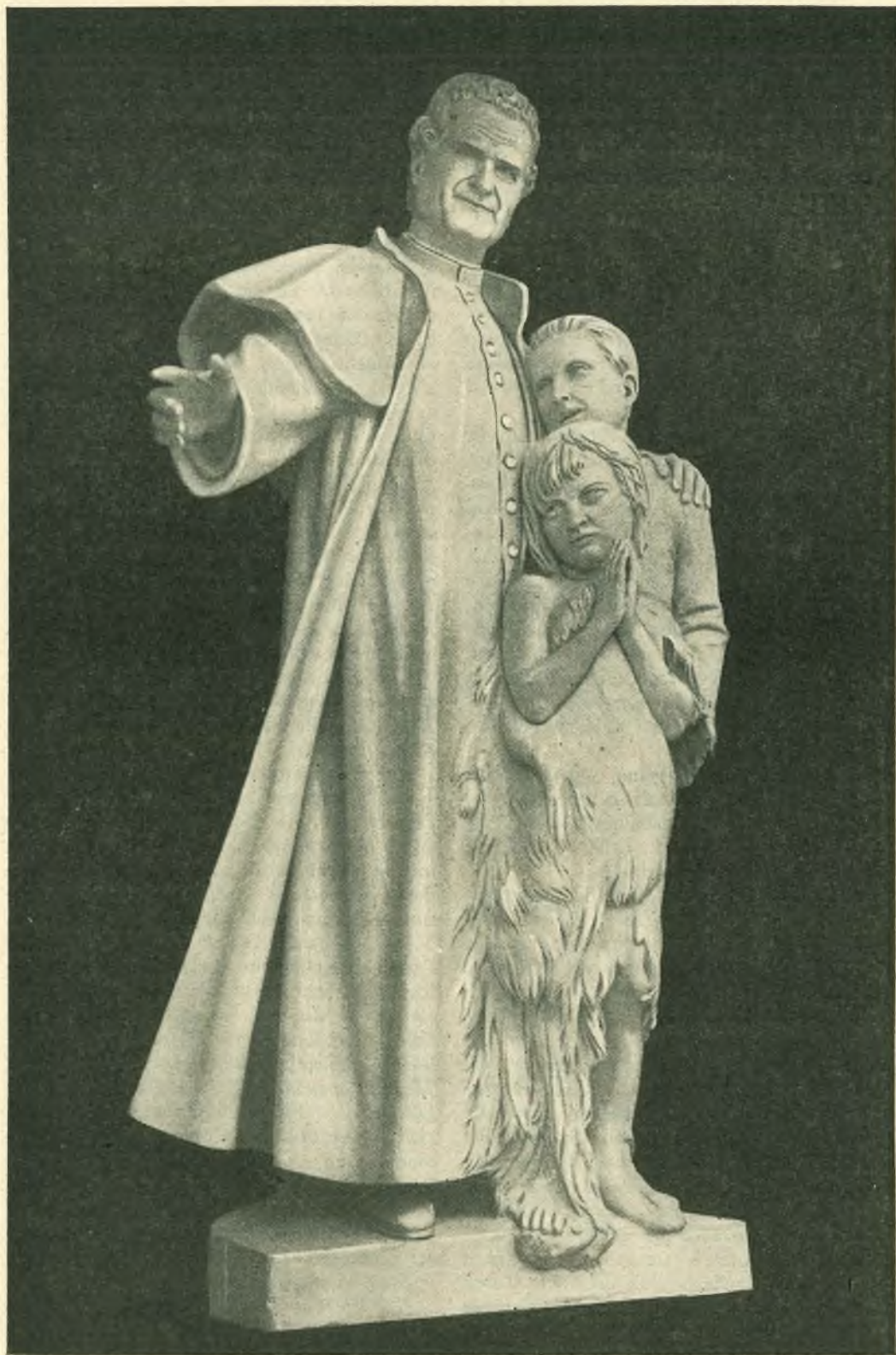
Il gruppo statuario di S. Giovanni Bosco scolpito da Pietro Canonica, collocato nella nicchia sovrastante la statua énea di S. Pietro nella Basilica Vaticana.