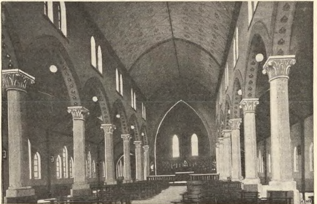
La Kafubu (Katanga). - La Chiesa della Missione.

il panico degli alunni e dei superiori. Superato il primo spavento questi si precipitarono verso le rovine ed ecco ai loro occhi lo spettacolo più raccapricciante. Nell'ala sinistra del fabbricato, alla sorpresa del ciclone, si trovavano 80 alunni assistiti dal maestro, sacerdote. La massa d'acqua aveva rovesciato i muri, spaccato i banchi e lasciato nella breccia un cumulo di macerie. Sotto le macerie quattro ragazzi morti; altri quindici gemevano spaventosamente feriti. Il confratello ferito anch'egli non capiva più nulla, in preda a penosa commozione nervosa. Delle quattro vittime più colpite una aveva un piede nettamente reciso, un'altra la testa letteralmente spaccata, e due orrendamente schiacciati. Ebbero appena il tempo di ricevere l'estrema unzione dalle mani del Direttore che, trovandosi providenzialmente in giro per la missione, proprio sul ponte che attraversa La Kafubu quando cominciava a scatenarsi il ciclone, era rientrato di corsa, senza tuttavia sospettare tutto quello che sarebbe successo in un baleno. Sotto l'atrio d'ingresso s'incontrò nella massa degli allievi neri terrorizzati che gli dissero che tutti gli altri, missionari e chierici, erano rimasti uccisi. Egli corse diffilato in chiesa a prendere l'Olio santo e raggiunse i poveri moribondi prima che spirassero. Avvisate le autorità, accorsero subito da Elisabethville il Commissario provinciale e il Commissario del Distretto con vari medici che raccol-