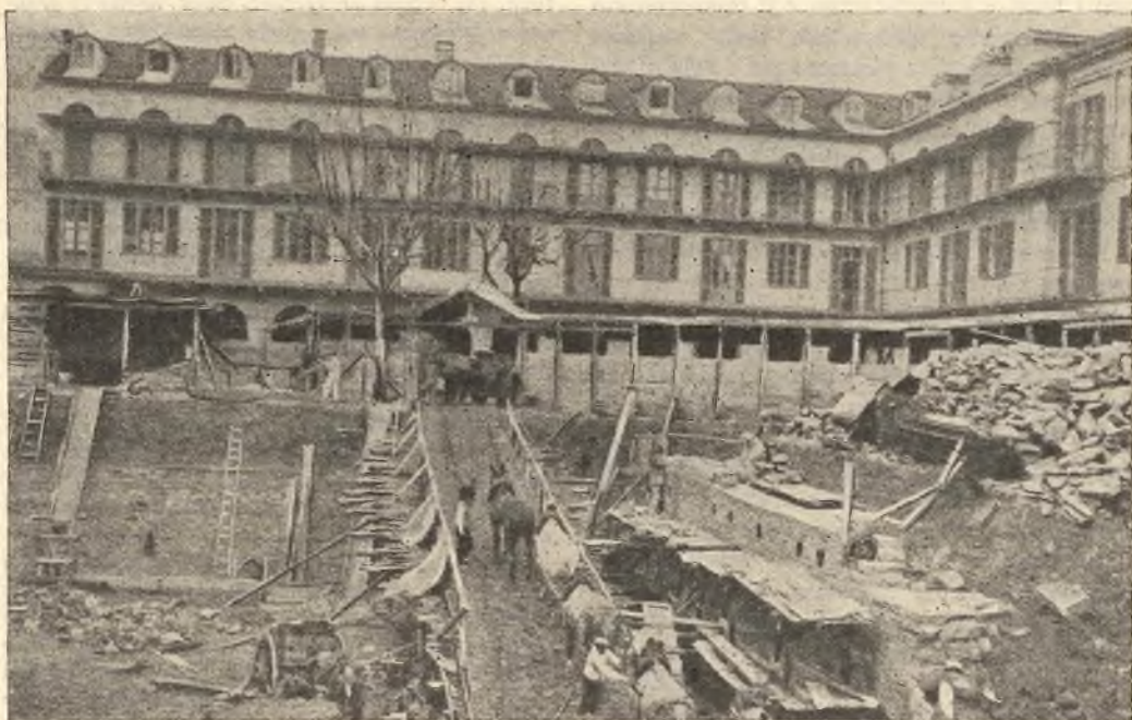
Torino. - Fervono i lavori per l'ampliamento della basilica di Maria Ausiliatrice.